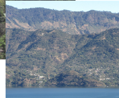
Sicht vom Atitlan See