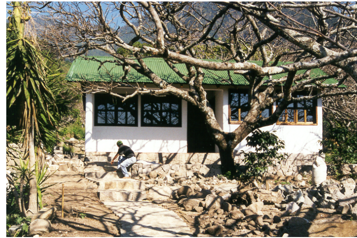
Hier entsteht unser erster Heilpflanzengarten

Einheimische Pflanzen, Homöopathie und Akupunktur können hier in Verbindung mit Aufklärung sehr gut eingesetzt werden. Trotzdem sie kostengünstig sind, können sich die bitterarmen Menschen diese Medizin und die Behandlungen kaum leisten.