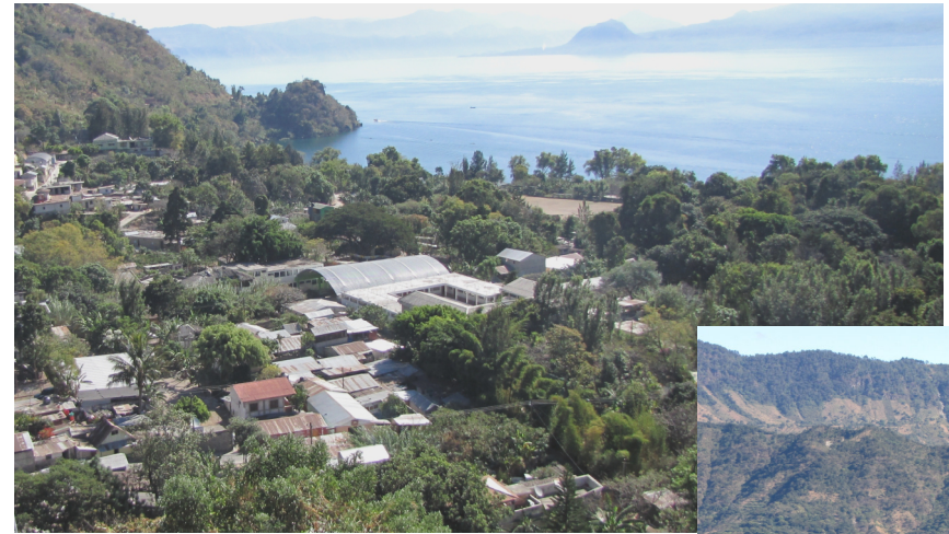
San Marcos la Laguna

Manfred Gritsch Rebweg 2 C 8353 Elgg Tel. 079 344 20 80