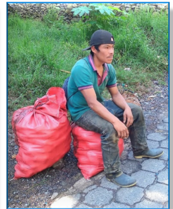
Was bringt die Zukunft?