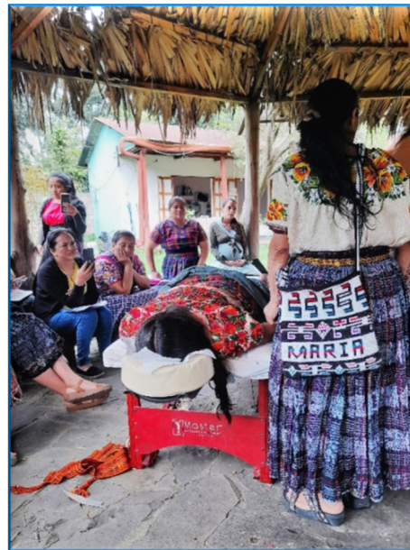
Massagekurs im Freien