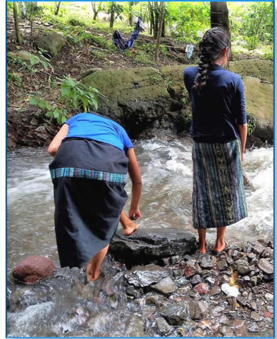
Wäsche waschen und Füße schrappen