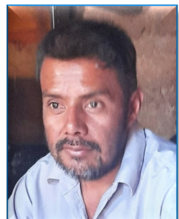
Blind durch unbehandelten Diabetes